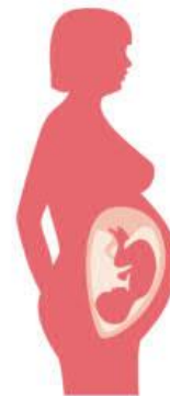
ОТ МАТЕРИ К РЕБЕНКУ